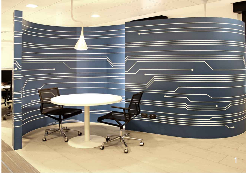
1 Area riunioni informali 2 Sala riunione cda 3 Area ristoro