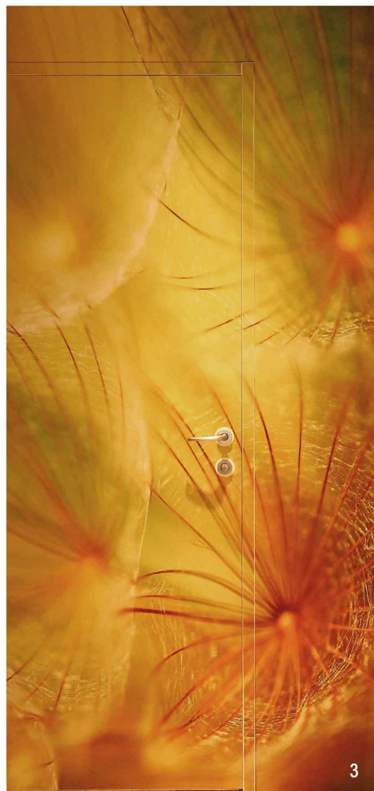
1 Corridoi e totem acustici 2 Dettaglio reception 3 Trattamenti grafici pareti